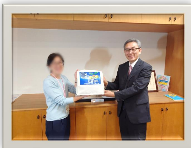
校長先生へ 応援旗を贈呈いたしました