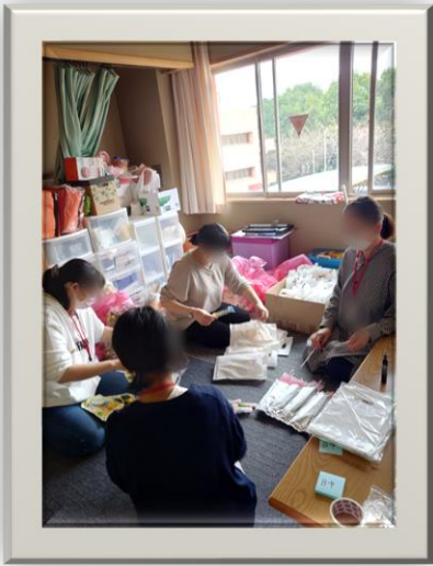
サポーターの皆様が 景品を梱包しました!

11月24日に行われました、ふたば祭初日PTAブースの ゲームコーナーレポートです。